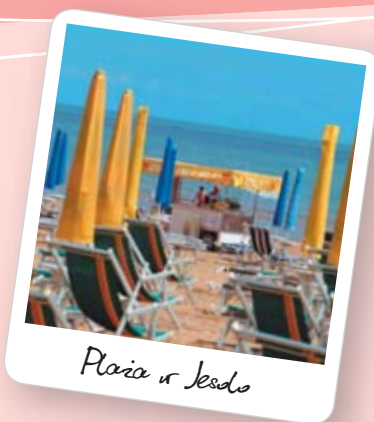
Plaża w Jesolo