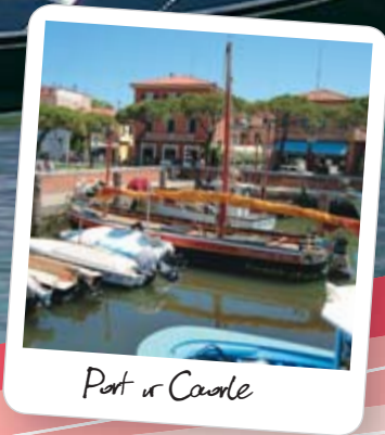
Port w Caorle