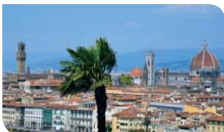
fol. Mirosław Nadziałek z Sandomierza

Samochody parkowane są z dala od namiotów i mobile home'ów Drugi samochód parkowany poza campingsiem Namioty na tym campingu są 5-osobowe