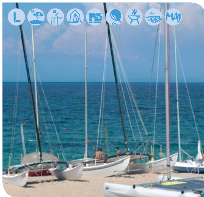
fol. Henryk Adamczyk z Lubina

Od połowy czerwca do końca sierpnia samochody są parkowane poza campingiem