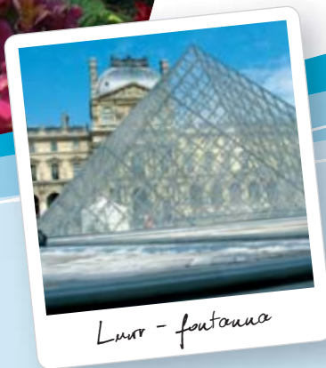
Luw - fontanna