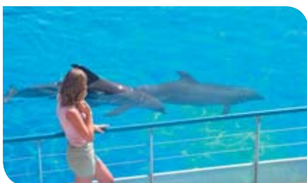
fol. Aleksander Wermczuk z Wrocławia