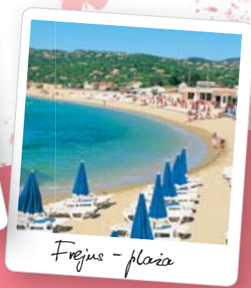
Fréjus - plaża