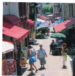
St. Jean de Luz