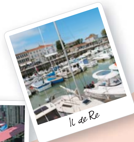
Il de Re