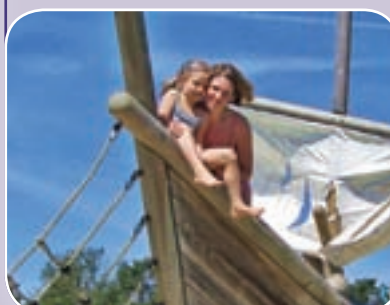
Fot. Anna Zajac z Goodkova